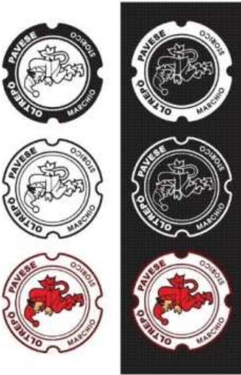
A colori su nero