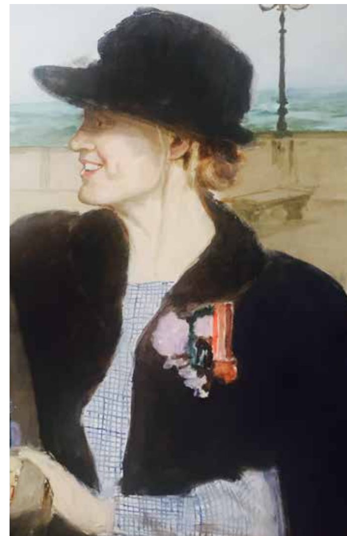
GE.GRAF - Bertinoro (FC)